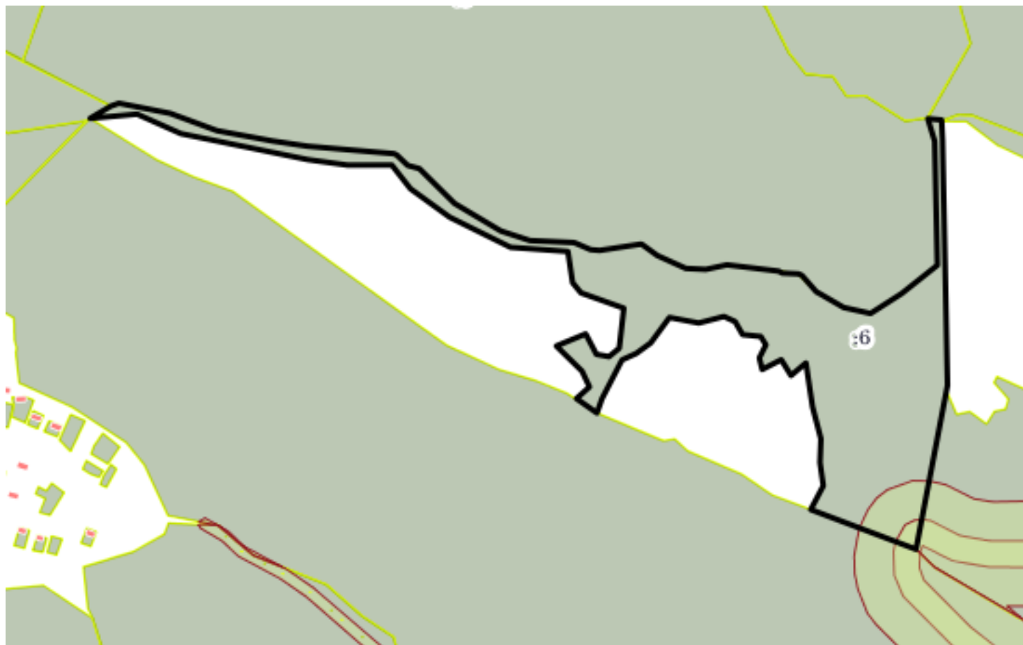
План (чертеж, схема) земельного участка