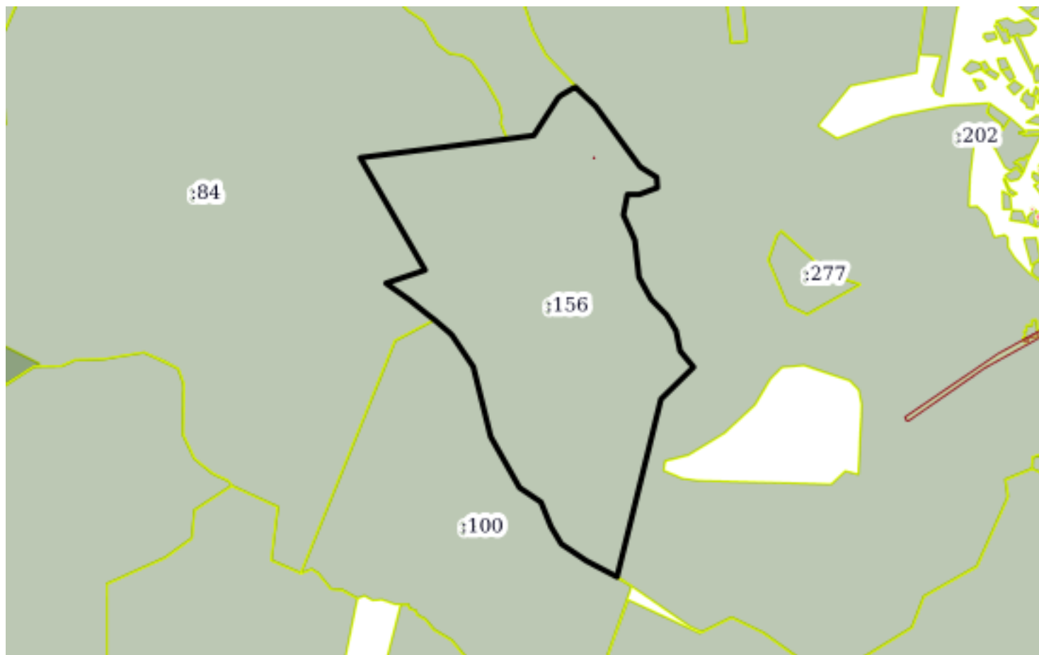
План (чертеж, схема) земельного участка