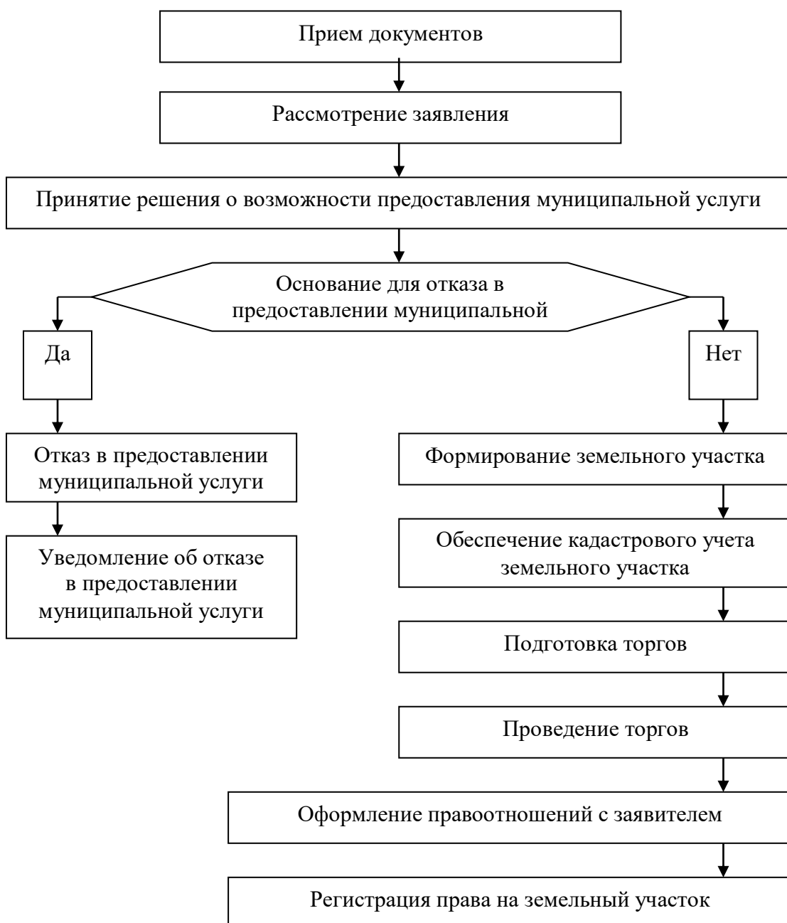
Блок-схема последовательности действий при предоставлении муниципальной услуги

Начальник отдела экономики и земельно-имущественных отношений МР «Ахтынский район»